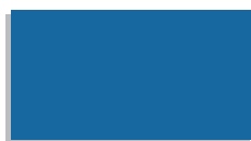
0455 středně modrý