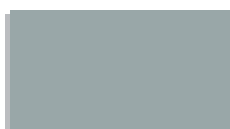
0101 pastelově šedý