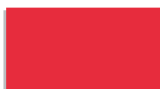
0820 světle červený