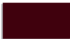
0245 tmavě hnědý