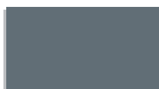
0111 světle šedý